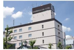
榎原オークホテル